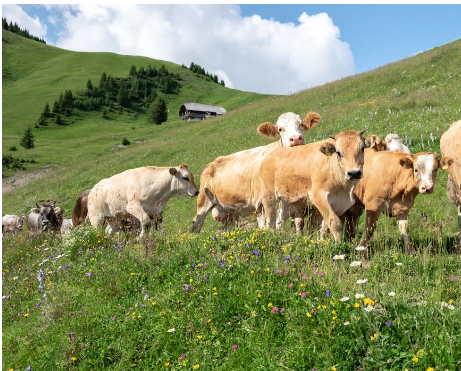
Zulligers Mutterkuhherde darf den Sommer auf einer Alp im Simmental verbringen.

Mutterkuh Schweiz wird einen Stand innerhalb des Produktemarktes betreiben. Es werden Trockenfleisch und Frischfleisch vom Natura-Beef-Bio zur Degustation und zum Kauf angeboten. Das Fleisch stammt vom Bio-Betrieb der Familie Zulliger aus dem oberaargauischen Madiswil. Schauen und hören Sie hier, was für Zulligers das Natura-Beef-Bio einzigartig macht. Natura-Beef-Bio gibt es am Bio Marché, direkt beim Bauern – zum Beispiel bei Familie Zulliger – und bei Coop.