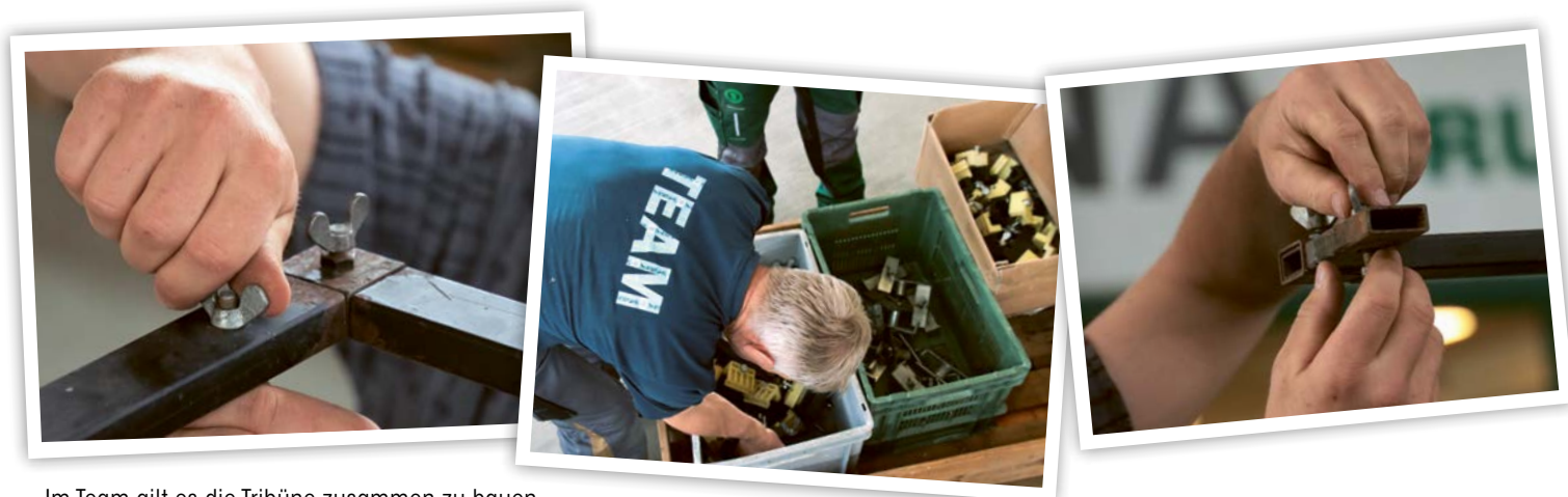
Im Team gilt es die Tribüne zusammen zu bauen.

ich mich für sie interessiere. Auf die Idee, etwas über die emsige Truppe zu schreiben, bin ich an der Swissopen next generation gekommen, als die Bündner auch im Einsatz waren. Am Schluss der Veranstaltung ging es ruckzuck und die Tribüne, der Schauring und das Sägemehl waren verschwunden, als wären sie nie dagewesen. Die «Heinzelmännchen» gibt es also doch – dachte ich mir und die Idee für diesen Text war geboren.